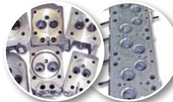
MB 300 SL

> die Beseitigung von Rissbildungen und Beschädigungen